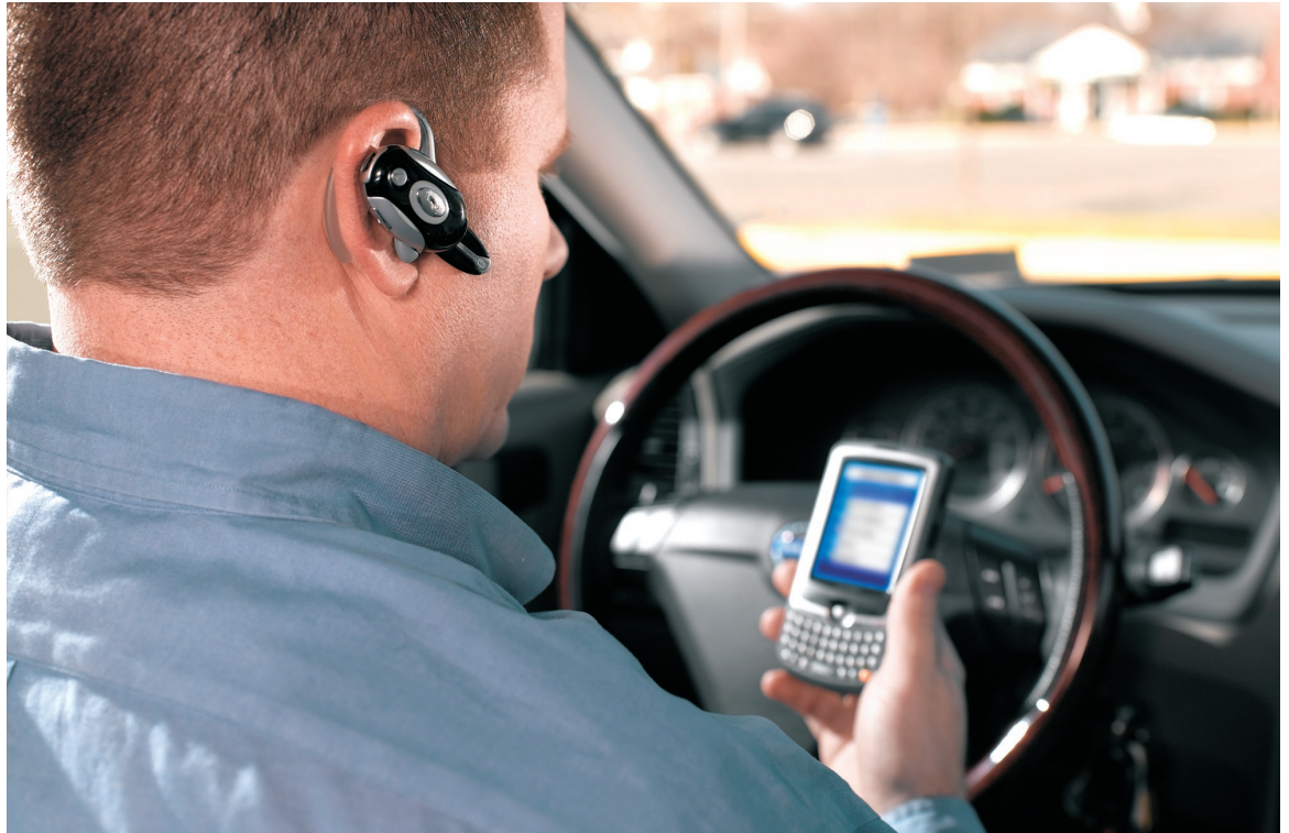
Az MC35 egyszerűbbé teszi az értékesítők és ügyfélszolgálati szakemberek életét menet közben egyetlen kompakt, de strapabíró készülékben számtalan üzleti funkciót biztosítva — beleértve a hangtovábbítást, a vonalkód-leolvasást, a képrögzítést és a levelezési, az SFA, CRM, ERP és egyéb üzleti alkalmazásokhoz való hozzáférést.

Különbféle adatbeviteli módokat tesz lehetővé az egyes alkalmazások szolgáltatásait kihasználva és a felhasználó egyéni preferenciáinak eleget téve