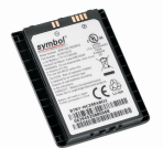
Nagy kapacitású akkumulátor (2740 mAh)