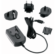
Nemzetközi utazó töltőkészlet